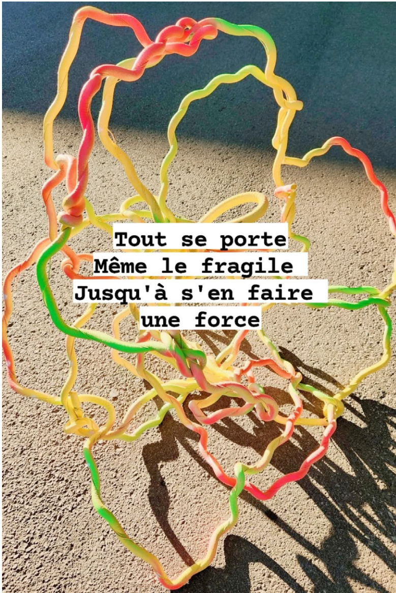
Œuvres de Kim Lafontaine

Résidence Dehors est un poème à la Promenade de la poésie, Trois-Rivières, 2025