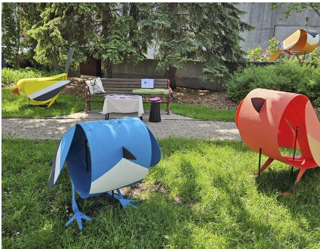
Photo avec l'installation Les passereaux du collectif L'abricot par Myriam Legault-Beauregard