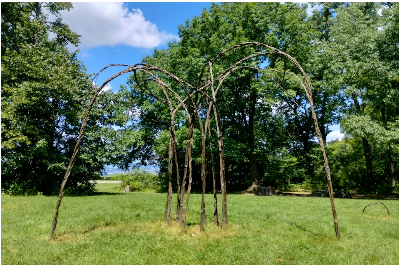
Photo de l'œuvre L'étreinte des temps de la Société des archives affectives par Joël Pourbaix

Peu importe où vous êtes en ce moment, arrêtez. Attendez. Cherchez un lieu n'appartenant à aucune carte ou dénomination. Cherchez un lieu de l'infiniment petit, secret et ordinaire, dans lequel se manifeste pourtant l'infiniment grand. Cherchez ce que l'aveuglement de la lumière empêche de voir. Cherchez ce qui se meut à l'envers du vacarme.